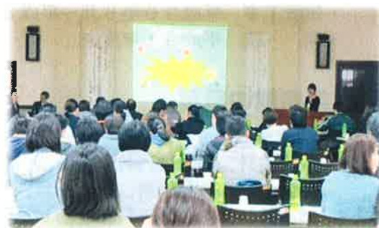
<公立新小浜病院 NST 委員会>